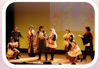
NPO法人キャトル・リーフ