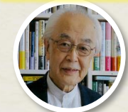
ノンフィクション作家 柳田邦男