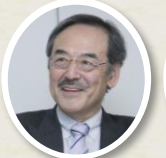
倫理学者 清水哲郎