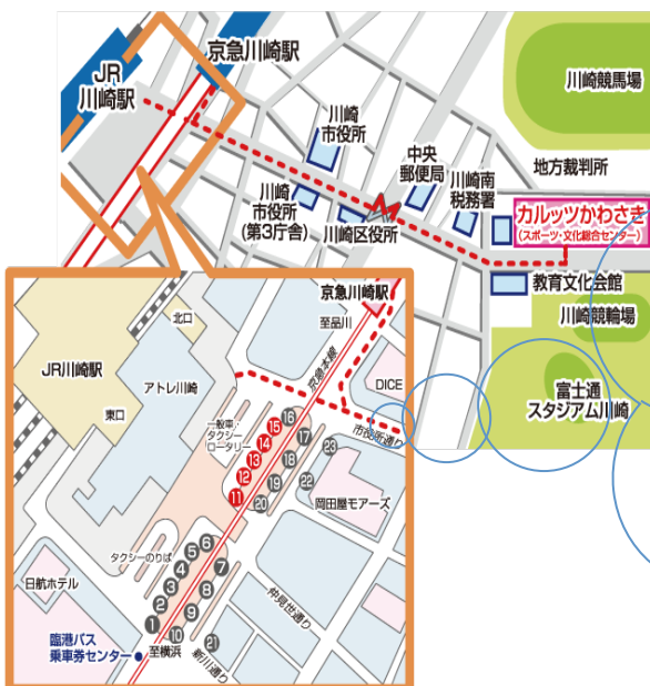
川崎駅東口拡大図